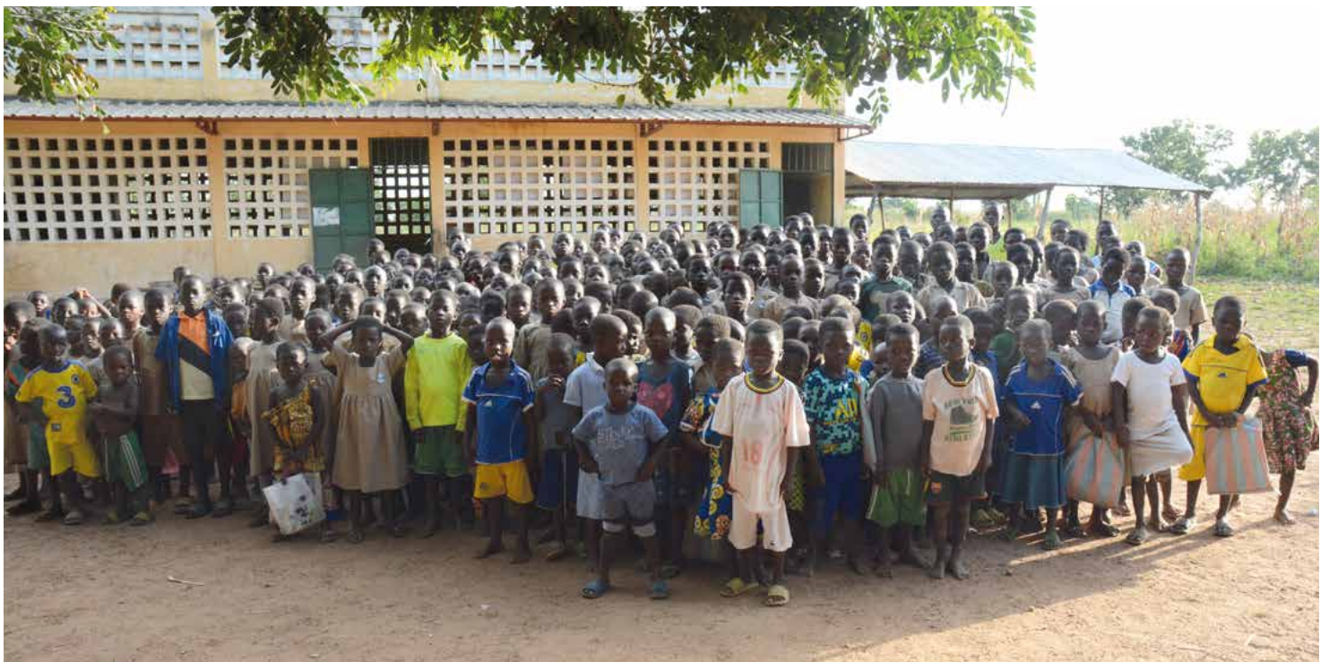
Für die 226 Schülerinnen und Schüler der Grundschule Nargbal hat im September das neue Schuljahr in begonnen.